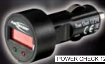
POWER CHECK 12/24V