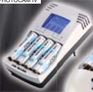
ENERGY 16 PLUS