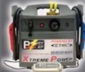
XTREME POWER 2600