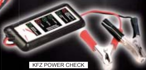
KFZ POWER CHECK